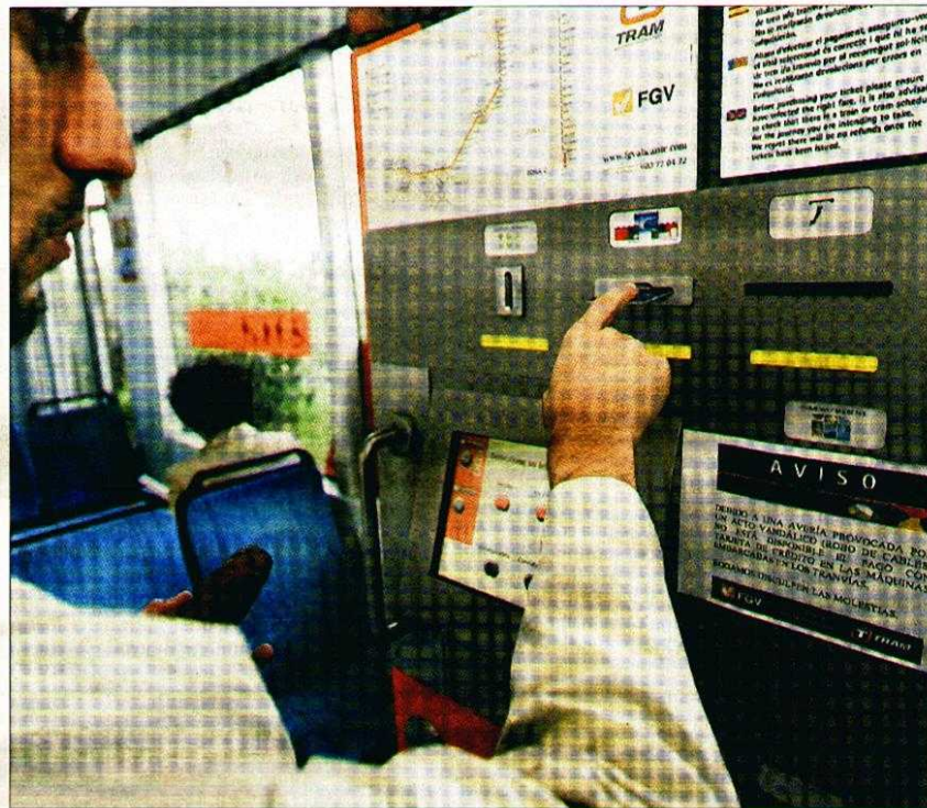
Un cartel avisa de la incidencia en las máquinas expendedoras del interior de los tranvías. DANIEL MAS

► La línea entre El Campello y Benidorm sufrió tres actos vandálicos el fin de semana que provocaron el corte de comunicaciones varias horas en un tramo